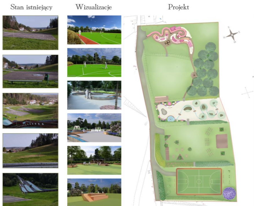
Rysunek 5. Projekt zagospodarowania terenu przy kompleksie skoczni narciarskich „Zakucie” w Zagórzu – koncepcja projektowa

gajnik z hamakami, a także platformę widokową z widokiem na klasztor oo. karmelitów bosych (naczelny wyróżnik krajobrazu Zagórza). Druga strefa – wodna – to strefa, która skupia się na rekreacji i odpoczynku w otoczeniu wody. Centralnym elementem jest wodny plac zabaw w formie podwyższonego kanału z interaktywnymi elementami. Strefę uzupełniają dwie fontanny, kaskadowa i z dyszami w nawierzchni, oraz ozdobna rabata. Trzecia strefa – koncertowa – to strefa sprzyjająca budowaniu więzi społecznych. Jej centralnym elementem jest scena koncertowa umożliwiająca organizację lokalnych wydarzeń, otoczona przestrzenią do gromadzenia się ludzi. W pobliżu znajduje się część gastronomiczna z trzema budkami serwującymi jedzenie i napoje oraz stoliki i ławki. Czwarta strefa – sportowa – zachęca do aktywnego wypoczynku, oferując możliwości ruchu dla różnych grup wiekowych i poziomów sprawności. Znajduje się tu wielofunkcyjne boisko z torem biegowym oraz siłownia zewnętrzna z trzema urządzeniami wielofunkcyjnymi. Zaproponowana koncepcja przywraca opuszczonym terenom użytkowy charakter (por. rysunek 5) i pozwala rozszerzyć ofertę turystyczną Zagórza skupiającą się obecnie na klasztornych ruinach.