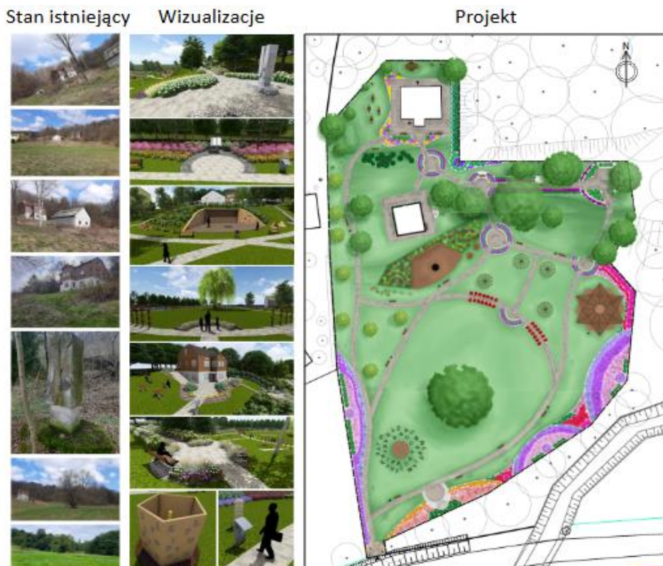
Rysunek 4. Park pamięci poety Juliana Przybosa w Gwoźnicy Dolnej – koncepcja projektowa